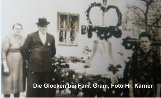
Die Glocken bei Fam. Gram