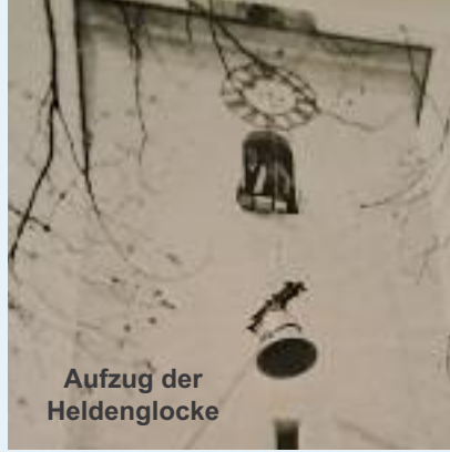
Aufzug der Heldenglocke