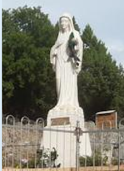
Die Statue der Gottesmutter an der Stelle, wo sie im Jahre 1981 erstmals den Kindern erschienen ist.