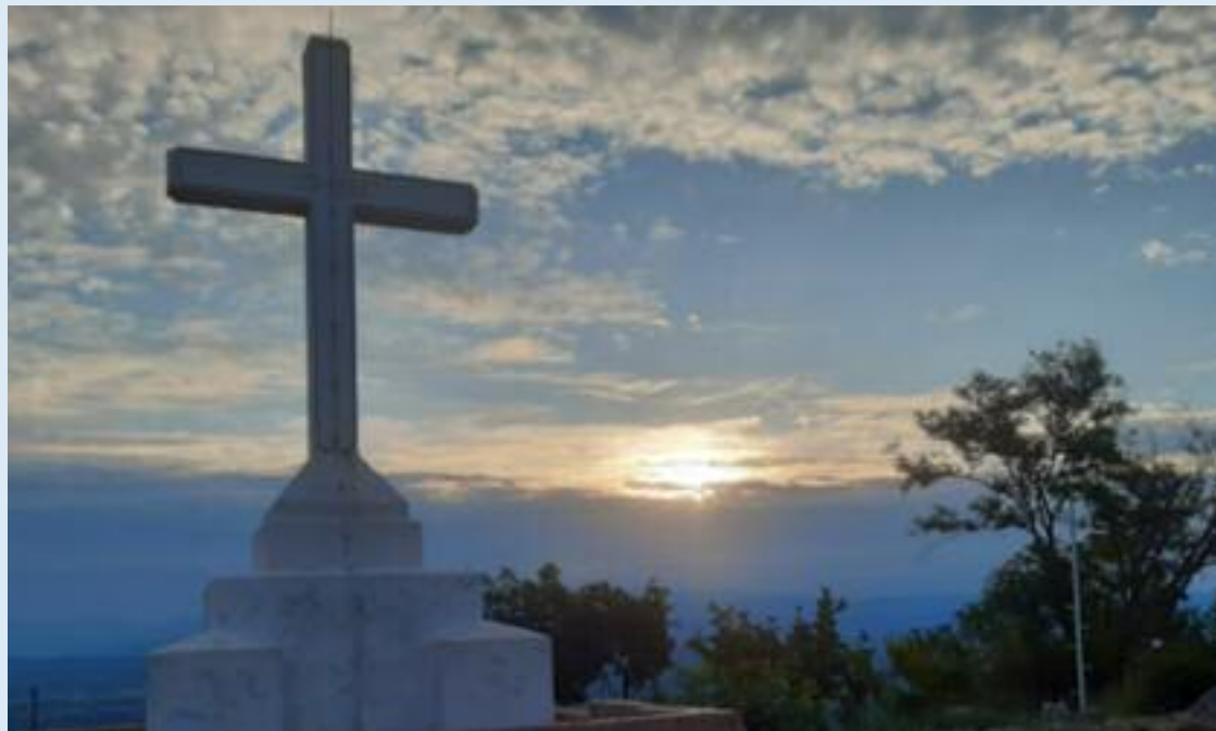
Stimmungsvoller Sonnenuntergang auf dem Kreuzberg von Medjugorje.