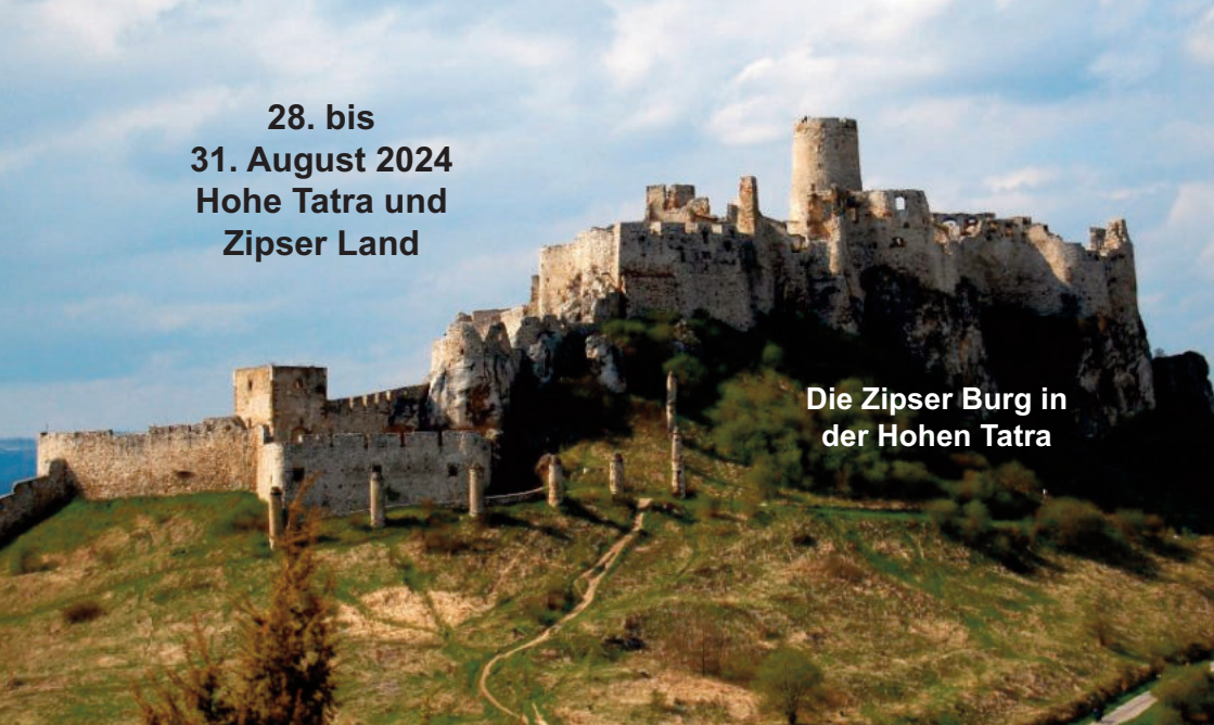
Die Zipser Burg in der Hohen Tatra

28. bis 31. August 2024 Hohe Tatra und Zipser Land