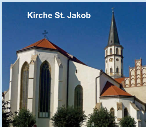
Kirche St. Jakob

Unser Weg führt uns heute in die mittelalterliche Stadt Levoca, Königin der Zips. Die Kirche St. Jakob beherbergt den größten Holzaltar der Welt. Altstadt und Kirche sind Teil des UNESCO-Welterbes, genau wie die Zipser Burg, unser nächstes Ziel. Die mächtige Ruine dieser frühslawischen Festung ist die zweitgrößte Burganlage Mitteleuropas. Danach Rückfahrt zum Hotel Satel in Poprad und Abendessen im Hotel.